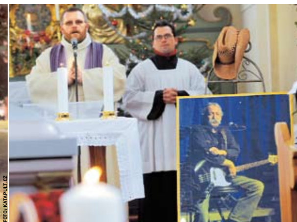
Vlevo v lacláčích: Dědku se mu říkalo prý proto, že tak vypadal už od plenek