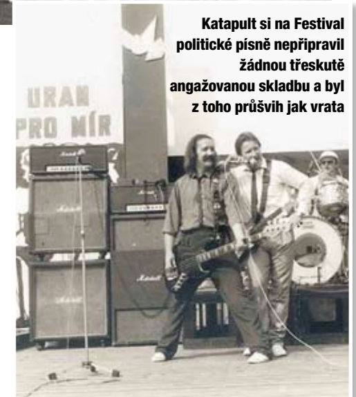
Katapult si na Festivalu politické písně nepřipravil žádnou třeskutě angažovanou skladbu a byl z toho průšvih jak vrata

To už jsme ale v hloubi 20. století, v roce 1965, kdy se Plzeň stávala vedle Prahy rock-