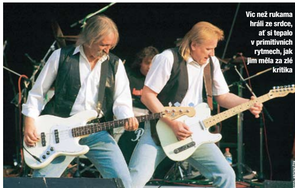
Víc než rukama hráli ze srdce, ať si tepalo v primitivních rytmech, jak jim měla za zlé kritika

co, co je ještě podstatnější: cit, duši, srdce, které se nedají předat v žádné lekci a bez nichž zůstává i nejtechničtější hráč na nástroj jen robotickou skořápkou. Tyhle atributy nescházely ani budoucí katapultové trojici a i v tom lze vidět podstatu tajemství jejich dlouhověkosti, přetrvání až k nesmrtnosti. Víc než rukama hráli ze srdce, aťsi tepalo v primitivních rytmech, jak jim to od počátku měla za zlé kritika, autorská jména, která na rozdíl od nich zmizela v žurnalistickém dějinném propadlišti.