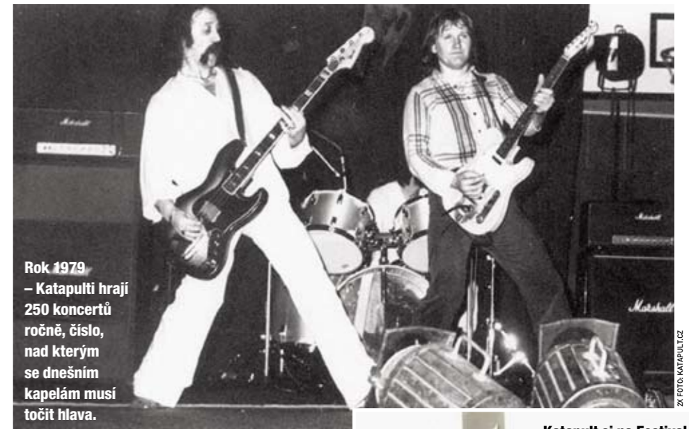
Rok 1979 – Katapultí hrají 250 koncertů ročně, číslo, nad kterým se dnešním kapelám musí točit hlava.